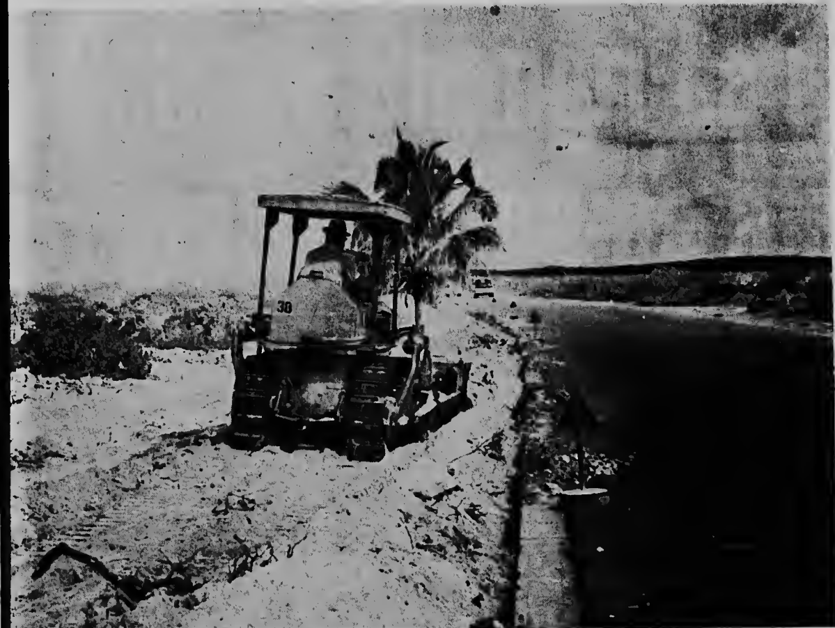
E foto aki tambe ta relaciona cu e realizacion di e "Plan Malmok". E tubonan cu a worde instala ya a worde tapa cu santu blanco y un wals ta haciendo e terreno lizo atrobe. E gastonan di instalacion lo ta mas o menos Fls. 130.000,-. Na cumintamento di 1966 nan ta spera cu e instalacion di e tubonan na un largura di tres kilometer lo keda completamente cla.